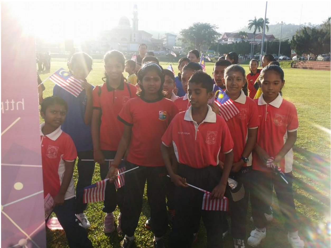
Sebahagian peserta Klik Dengan Bijak